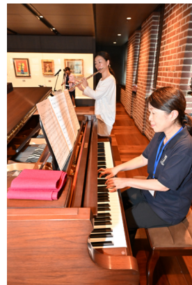
交 流 会